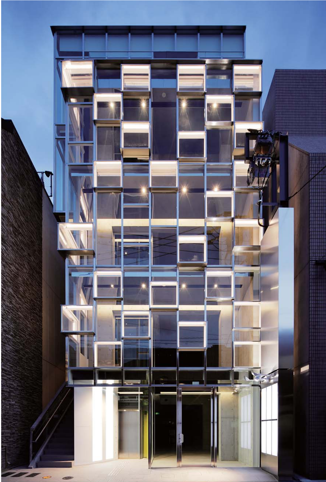
Facade : 福岡城の石垣や石積を現代素材のガラスで表現。